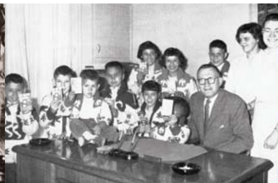
1961 : Neuf nouveaux clients ouvrent un compte de la Banque Royale à Terrace (C.-B.).