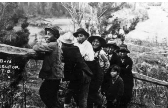
v. 1914 : Village de Hazelton (C.-B.), où se trouve un poste de traite – en 1977, la Banque Royale déménage cette succursale dans le village autochtone de Hagwilget.