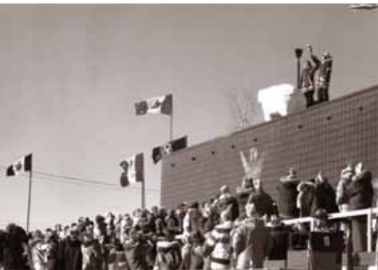
1978 : Jeux d'hiver de l'Arctique, Hay River (T. N.-O.) – soutenus par RBC depuis 1977.