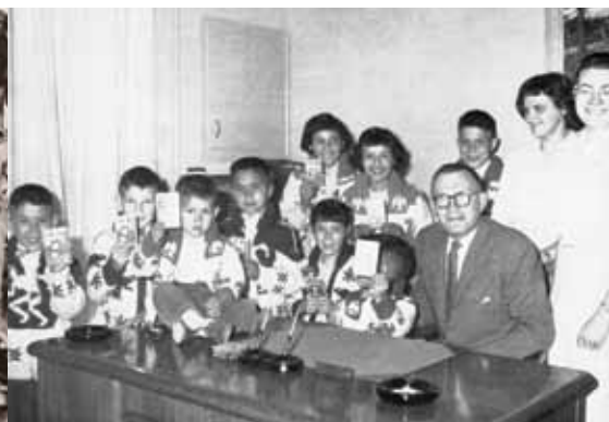
1961 : Neuf nouveaux clients ouvrent un compte de la Banque Royale à Terrace (C.-B.).