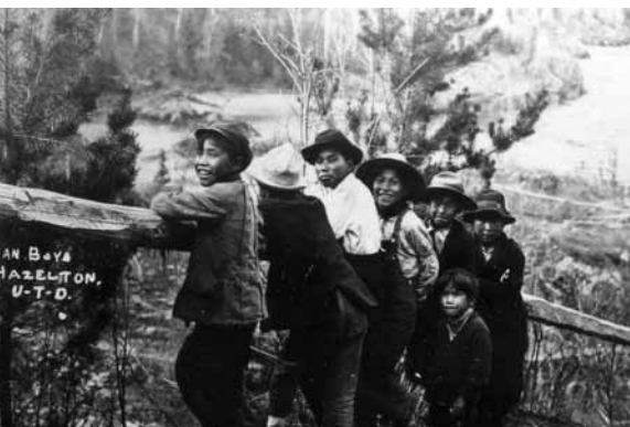
v. 1914 : Village de Hazelton (C.-B.), où se trouve un poste de traite – en 1977, la Banque Royale déménage cette succursale dans le village autochtone de Hagwilget.