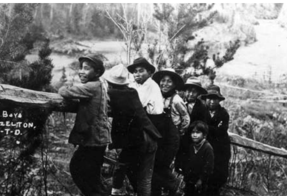
c. 1914 : Village de Hazelton (C.-B.), où se trouve un poste de traite – en 1977, la Banque Royale déménage cette succursale dans le village autochtone de Hagwilget.