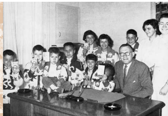
1961 : Neuf nouveaux clients ouvrent un compte de la Banque Royale à Terrace (C.-B.).