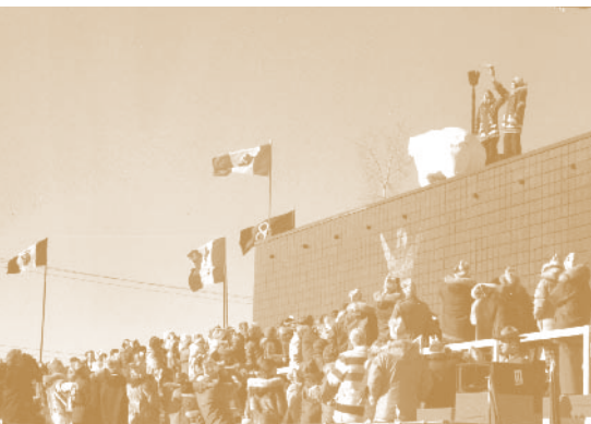
1978 : Jeux d'hiver de l'Arctique, Hay River (T.N.-O.) – soutenus par RBC depuis 1977.